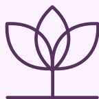
FĂRĂ MEDICAMENTE SAU STIMULENTE